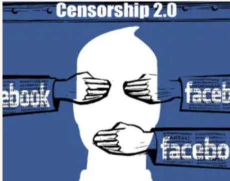
De échte reden waarom Facebook alternatieve media blokkeert