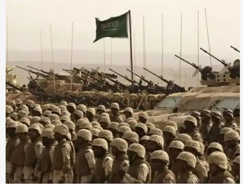
"Grondoffensief in Syrië betekent start van Derde Wereldoorlog"