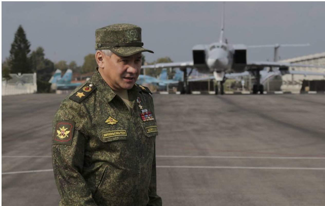
Russian Defense Minister Sergey Shoigu

Sergey Shoigu's visit to Russia's Hmeymim air base and Tartus naval logistics facility points to the "significance that Russia attaches to these facilities in global stand-off," Charles Abi Nader noted