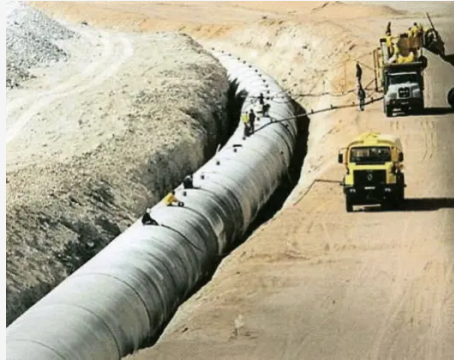
Wat is er gebeurd met Gaddafi's Great Man Made River?